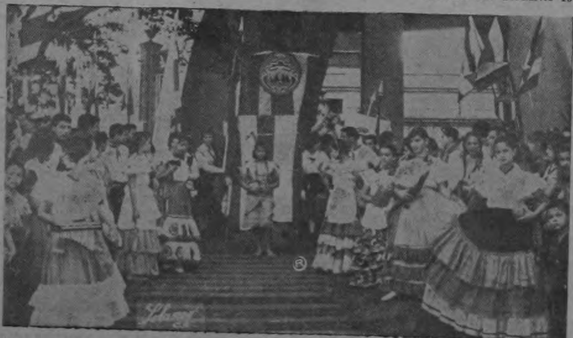
Alumnas del Liceo San José, luciendo hermosos y típicos trajes nacionales, ponen una nota de colorido en las celebraciones de la Anexión de Gua-

"De acuerdo con el articulado, el monto de las sumas que se gasten en Admon., deberá ser inferior al 25% del total de ingresos. No obstante, en el período de mayo 1962 a mayo 1963, la organización incurrió en gastos por la suma de ₡ 11.790.50, es decir el 37.45%. Otra irregularidad que se observa en relación a las erogaciones es por concepto de compras de juguetes en 1961. Según el acuerdo la suma sería de 9.527.15 y en el informe económico aparece la suma de 10.027.15". Es un informe de la Oficina de Sindicatos del Ministerio de Trabajo. — TEXTO EN PAGINA 4 —