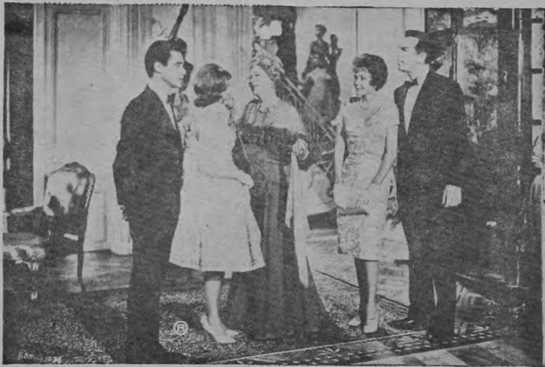
La condesa Du Fresne (Jessie Royce Landis) saluda a Any (Deborah Walley), Katie (Jane Wyman) y Harry (Fred Mac Murray) quienes asisten al coctel que ella da en honor de su hijo Nick (Michael Callan) en la película "Por Fin París" (Bon Voyage), una producción de Walt Disney filmada en technicolor.

"Las escenas de la playa, ¿las reconstruimos en estudio?", preguntaron a Walt Disney, antes de iniciar la filmación de BON VOYAGE (Por Fin París!).