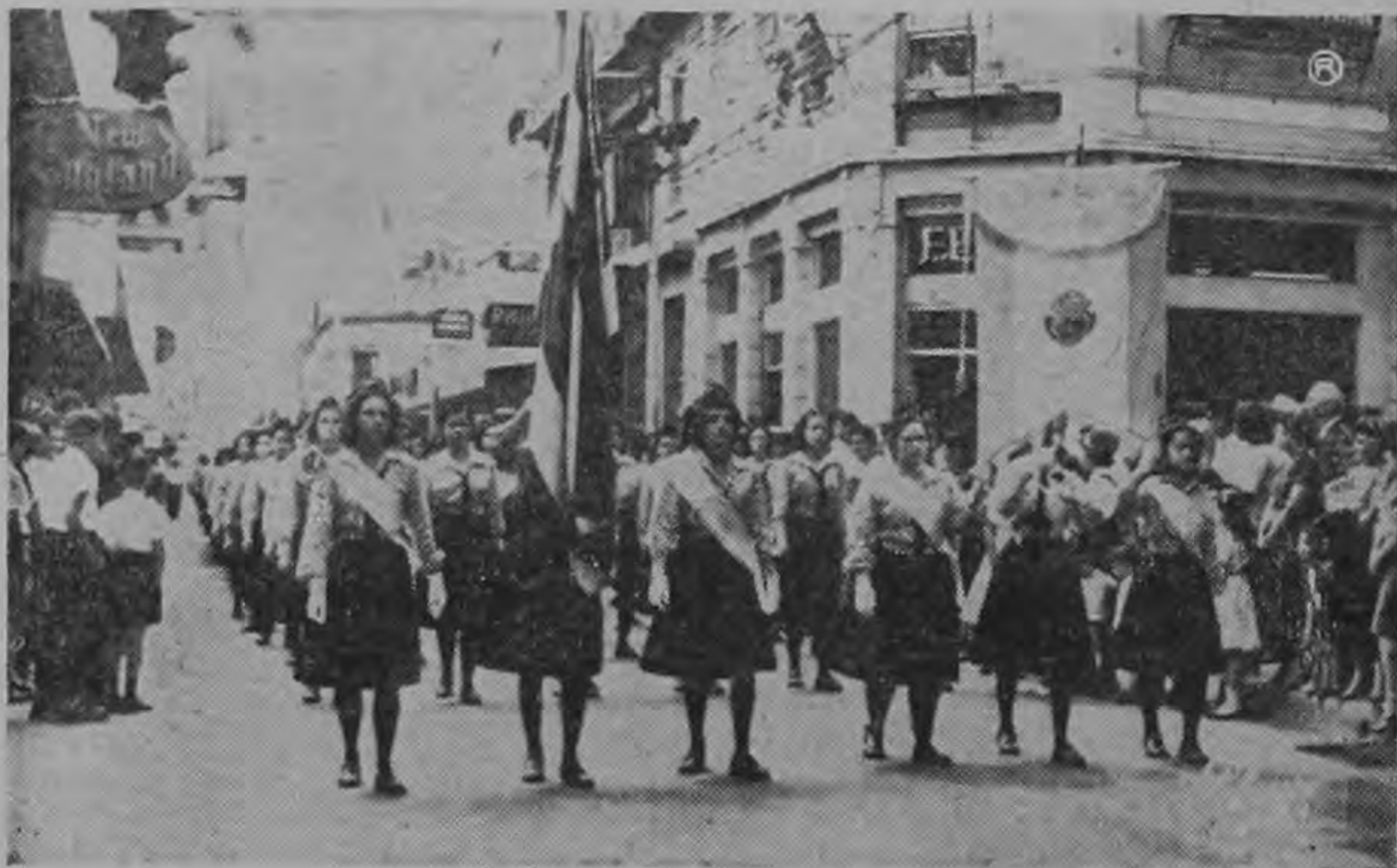
Una de las fases del gran desfile de ayer por las calles de la Capital, con motivo de las celebraciones por la Anexión. En la gráfica aparece el