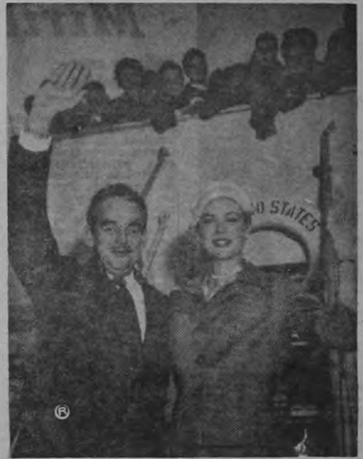
"La romántica pareja que ha hecho realidad los cuentos de hadas: la bella y el príncipe. Grace Kelly y Raniero, cuyo idilio es un alto ejemplo de amor y de felicidad conyugal..."