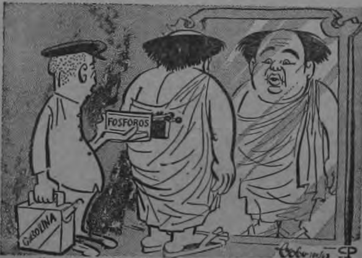
"...Y KRUSCHEV MANDO ESTO TAMBIEN."

El Primer Ministro se cuidó de expresar con demasiada claridad sobre el próximo paso en las negociaciones entre Oriente y Occidente y sobre cualquier iniciativa nueva que el mismo pueda emprender.